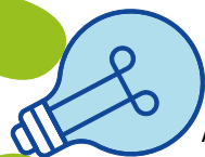
LAMPADINE A FLUORESCENZA